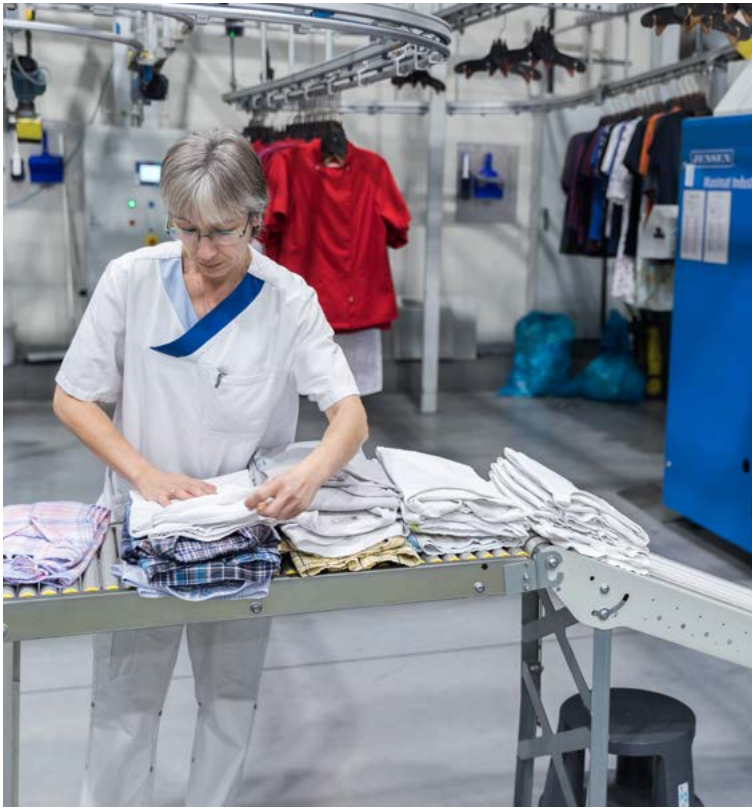
Auf eine einwandfrei aufbereitete Wäsche legen die Wäscherei und deren Kunden viel Wert.

Möglich wird die Leistung nicht nur durch die Mitarbeitenden, sondern auch durch modernste Technik und eine ausgeklügelte Organisation. So soll der Betrieb seine wirtschaftliche Stabilität sichern und neue Kunden gewinnen. Daher wird auch das Know-how der Belegschaft stetig weiterentwickelt, die neben der Wäscheaufbereitung auch einen Hol- und Bringdienst sicherstellt.